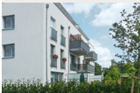
Beispielobjekte aus unseren Fonds

Seit 2007 legen wir erfolgreich Themenfonds für institutionelle Anleger auf. Investitionsobjekte sind deutsche und europäische Wohnimmobilien. Daneben bieten wir maßgeschneiderte und individuell optimierte Fondslösungen an, wie Individualfonds und Einbringungsvehikel. Diese Fondsprodukte berücksichtigen die individuellen Präferenzen unserer Kunden hinsichtlich Risiko, Fungibilität, Rendite und Haltedauer.