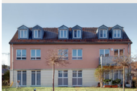
Beispielobjekte aus unseren Fonds